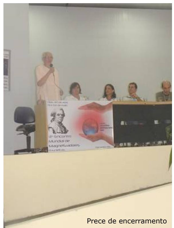
Prece de encerramento