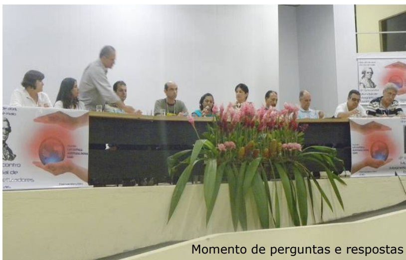
Momento de perguntas e respostas

Mensagem recebida por via sonambúlica em Parnamirim, 02 de Maio de 2010