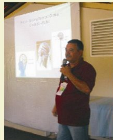
Francisco do LEAN/RN

Sob o intenso calor do verão nordestino, foram três dias repletos de atividades, onde explicações e demonstrações ao vivo, realizadas por pessoas de vários lugares, trouxeram novas experiências e aprofundamento sobre o magnetismo, tudo num clima de muita harmonia e fraternidade. O Encontro foi apontado por muitos como um evento de profundas repercussões, tanto a curto como a longo prazo, tendo como missão o despertar das consciências para o quanto podemos aprender e desenvolver a respeito da prática magnética no meio espírita, proporcionando ajuda a tantas pessoas que precisam. Ficam os parabéns para os seus idealizadores e realizadores e que outros Encontros como este possam vir a acontecer.