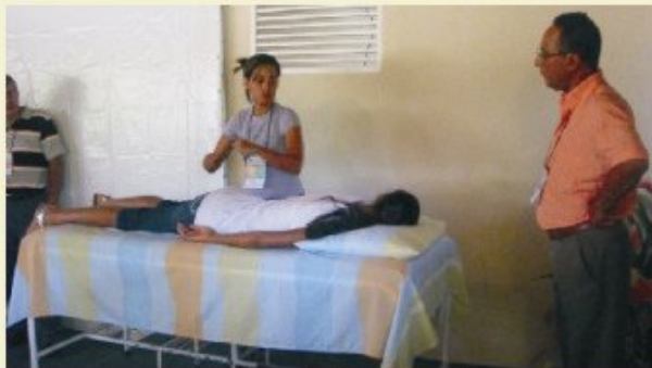
Equipe de Itabuna/BA