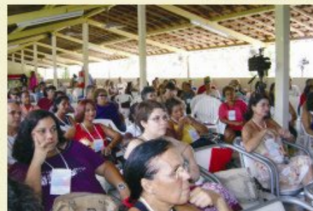
Visão do salão