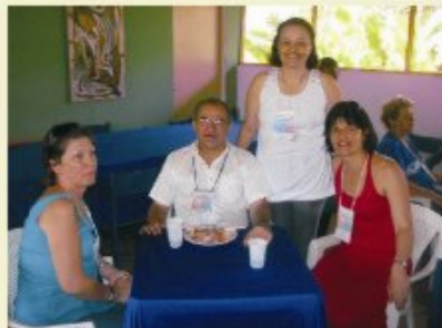
Momento de relaxamento no almoço