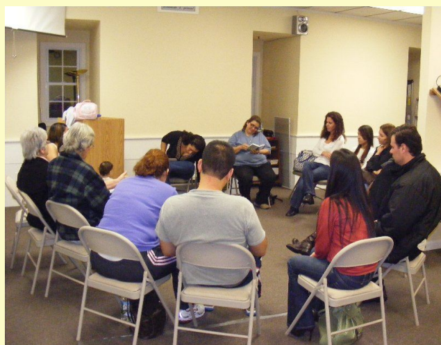
GETUH - grupo de Marlboro