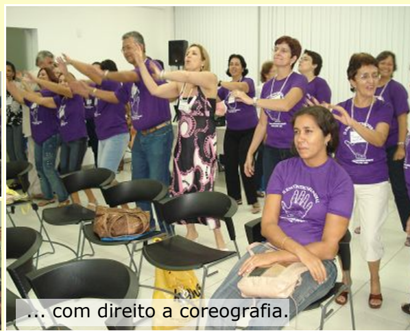
... com direito a coreografia.