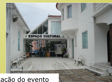
Local de realização do evento