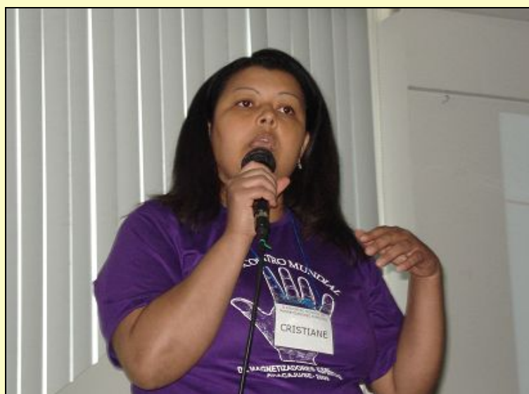
Paciente com lúpus relatando a doença e o tratamento

Quanto à paciente com lúpus (foto ao lado), ainda continua no tratamento iniciado há um ano e quatro meses. Segundo ela, os progressos a partir do tratamento magnético foram muitos, como suspensão das dores sentidas em inúmeras regiões do corpo, redução drástica da medicação com corticóide, desaparecimento da infecção renal (em grau 4, grave) que causava perda de sangue e proteína na urina.