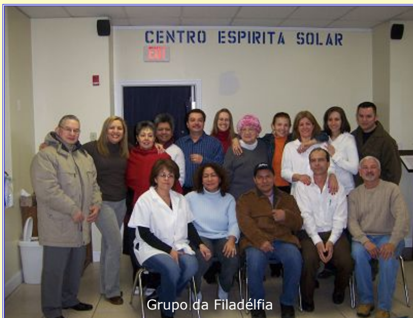
Grupo da Filadélfia

Segundo o relatório, “os resultados têm sido surpreendentes após a aplicação dessas técnicas, e foram obtidos a partir de relatos dos próprios assistidos”.